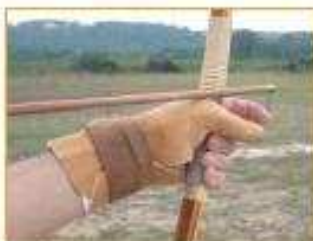
Prise de l'arc de la main gauche gantée en Kai

Quand l'arc s'ouvre peu à peu, sa poignée exerce dans la main gauche une pression qui peut aller jusqu'à 25 kg selon la puissance. Pour pouvoir tirer beaucoup on peut utiliser dans ce cas un gant souple qui n'empêche pas l'arc de tourner dans la main au moment de la décoche.