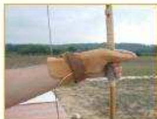
Prise de la main gauche après la décoche avec rotation de l'arc