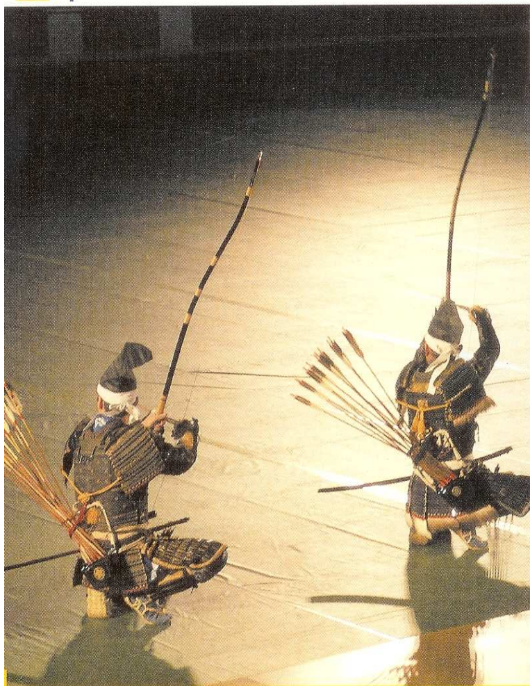
Le Kyudo, tir à l'arc japonais, est une recherche d'harmonie. En photo, les archers de Satsuma.