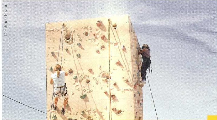
De nombreux sports pourront être pratiqués le 15 septembre.