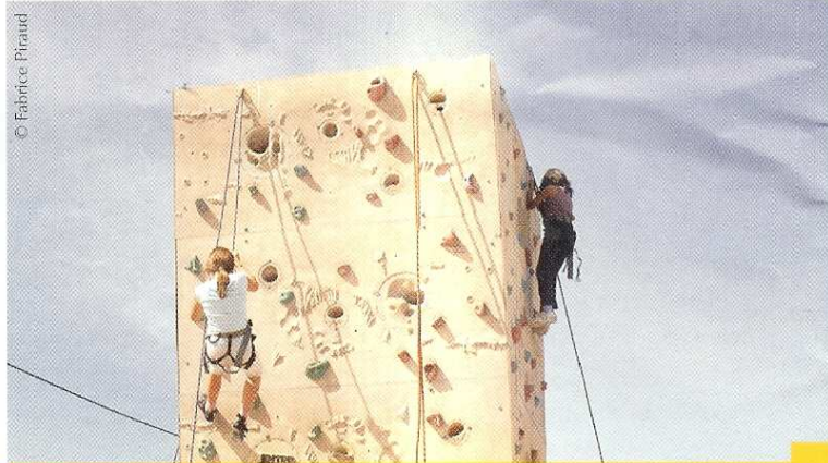
De nombreux sports pourront être pratiqués le 15 septembre.